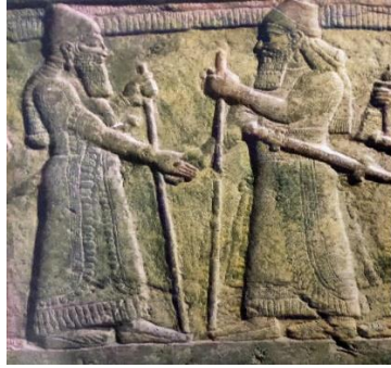
وینەى 3 دیمەنى ھاوپەیمانیپتی (صاحب، ۲۰۱۳، ص ۳۴۳)

بېگومان ھونەرى پەيكەرسازنۆر ئاشورى وەك ھونەرى جەنگ ناسراو، چونكە بەشپىكى زۆر لە دیمەنەكانى ئەم ھونەرە تايبەت بوو بەگيرانەوہى دەستكەوتەكان و نمايشكردنى ئەنجامى شكستى بەرھەلستكارانپان كە لە رېگای (فتوحات و جەنگەوہ) بەدەستپان دەھپنا لەھەمان كاتپشدا ئەم دیمەنانە دەرفەتپكى رەخساندوہ بۆ نمايشكردنى ئامپرو كەل و پەل و ھیزوتوانا سەربازپەكانپان كە تا رادەپەكى كارپگەرى ھەبووہ لە رۆخاندنى و رہى دوژمنانپان . بۆ نمونە لە دیمەنپكى ھەلكۆلدرائو لە سەر لەوھپكى بەردپن كە لە كۆشكى پاشای ئاشورى ناسر پالى دووہم ( ۸۸۳-۸۵۸ پ.ز) لە شارى نمرود دۆزراوہتەوہو ئیستا لە موزەخانەى بەرپتانيا پارېزراوہ(وینەى 4) . ئەم دیمەنە گوزارشت لە پەلامارى سەربازى بۆ سەر دوژمن دەكات ، برپتپە لە گالىسكەپەك دوو ئەسپ راپدەكپشپت بە ئاراستەى سەربازە ھپرش بەرەكان كە لەحالەتى ھپرش و پەلاماردان بە چەك و تفاقى جەنگپەوہ (الھپالى، ۲۰۱۹، ص ۳۶۳).