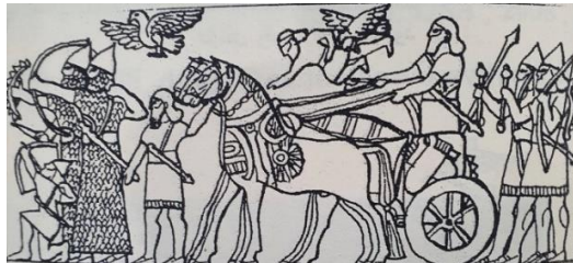
وینەى 4 دیمەنى گالىسكەى سەربازى

بېگومان ھونەرى پەيكەرسازنۆر ئاشورى وەك ھونەرى جەنگ ناسراو، چونكە بەشپىكى زۆر لە دیمەنەكانى ئەم ھونەرە تايبەت بوو بەگيرانەوہى دەستكەوتەكان و نمايشكردنى ئەنجامى شكستى بەرھەلستكارانپان كە لە رېگای (فتوحات و جەنگەوہ) بەدەستپان دەھپنا لەھەمان كاتپشدا ئەم دیمەنانە دەرفەتپكى رەخساندوہ بۆ نمايشكردنى ئامپرو كەل و پەل و ھیزوتوانا سەربازپەكانپان كە تا رادەپەكى كارپگەرى ھەبووہ لە رۆخاندنى و رہى دوژمنانپان . بۆ نمونە لە دیمەنپكى ھەلكۆلدرائو لە سەر لەوھپكى بەردپن كە لە كۆشكى پاشای ئاشورى ناسر پالى دووہم ( ۸۸۳-۸۵۸ پ.ز) لە شارى نمرود دۆزراوہتەوہو ئیستا لە موزەخانەى بەرپتانيا پارېزراوہ(وینەى 4) . ئەم دیمەنە گوزارشت لە پەلامارى سەربازى بۆ سەر دوژمن دەكات ، برپتپە لە گالىسكەپەك دوو ئەسپ راپدەكپشپت بە ئاراستەى سەربازە ھپرش بەرەكان كە لەحالەتى ھپرش و پەلاماردان بە چەك و تفاقى جەنگپەوہ (الھپالى، ۲۰۱۹، ص ۳۶۳).