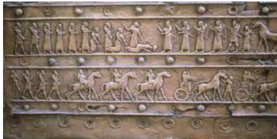
ناوی هونه رمه ند: هونه رمه ندانی ئاشووری