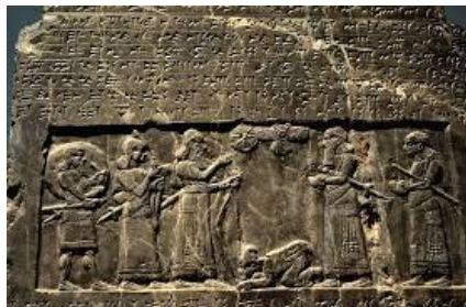
(وینە‌ی 2) کیله‌ی ره‌ش (المسله‌ السوءاء) صاحب، ۲۰۱۳، ص ۳۰۵