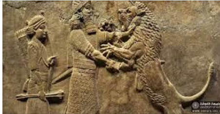
(وينهى 5) مظلوم، 1985، ج2، لابهرة 67-69

له لايهكى ترهوه تارادهپهكى بهرچاو ئهم ديمهنه هونهرىانه كرابوونه بهشيك له پىكهاتهى ميعمارى و زهخرهفى بيناسازى وهك ئامرازو كهرهستهى زهخرهفه بو نهخشاندن و رازاندنهوى ديوارى كۆشك و تهلارو دهروازى شارهكان به ديمهنى هيرش و پهلامارى سهربازى و ويئرانكردنى شار و پىگهى دوژمنهكانيان كه زور به تپرو تهسلى به شيوهپهكى وردو واقيعيانه سيمى هونرى ئهو سهردهمه بهرجهسته كراوه، (Beek Marthin a4, 1962, p.27). ئهمانه به گشتى بهلگه له سهرهنگدانهوى كارى سهربازى و جهنگ له ديمهنهكانى هونرى پهيكهرسازى وتابلوى گهچ و مهپمپرېگره له بوارهكانى هونرى تزيشدا (سليمان، 1993، لابهرة 342).