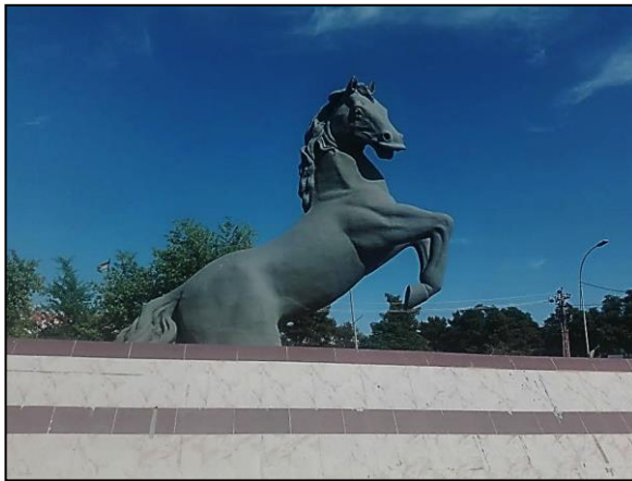
شیوه ی ژماره (2-3-1) ئه سپ نیشانه ی هیز و جوانى

تایبه تمه ندى و سیفه ته كانى له روى میژووویه وه په پیره و کردوو و قولا ییه کی مه عریفه ی هونه رى و نه ریته كانى خویان خسته روو، له بوون به هیز و جوانى له ناو سیفه ته جیهانى و ناوخوییه كاندا، بۆیه مۆنۆمېنتى (ئه سپ) له مادده ی له قالبدانى كۆنكریٲ دروست كراوه، رینگه ده دات به بوونى شوین جوانى گشتیدا رینگه به بوونى هیز و جوانى ده دات به شوین و تایبه تمه ندیه كانى جیهانى و ناوخوییدا بوونى هه یه، وهك له شیوه ی ژماره (2-3-1) دهرده كه ویت: