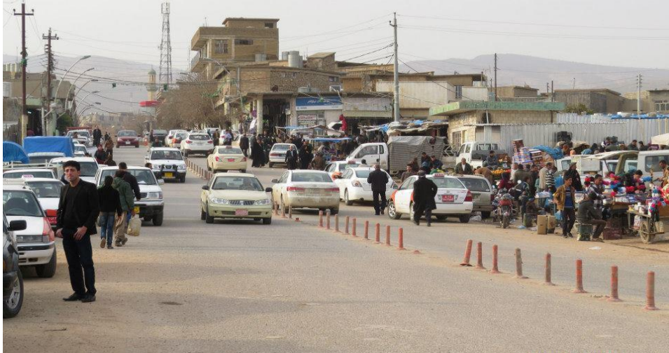
تویژه ران: له ١٧-١١-٢٠١٩- کاتژمیر (١٠) ی به یانی