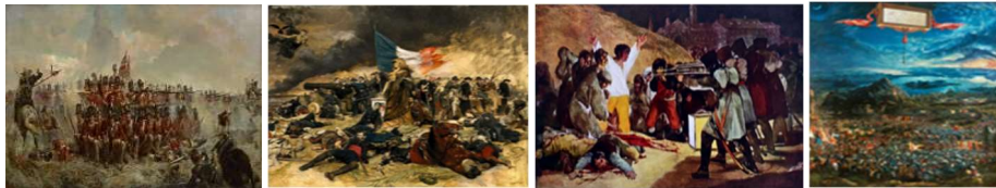
شێوه ی ژماره (1) شێوه ی ژماره (2) شێوه ی ژماره (3) شێوه ی ژماره (4)

سه رکرده کان. ئەمانه دیدگاگه لیک بوون که هه ولیان ده دا به ره نگاری ئەو نه ریته میژووویه بینه وه که هونه ر خزمه ت به لایه نی سه رکه وتوو ده کات له جه نگدا. " (دینا، آ، ف، 2022، ص. 46-49) بره وانه شیوه ی ژماره (4).