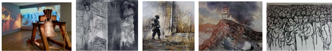
شىوہى ژمارە (۲۱) شىوہى ژمارە (۲۲) شىوہى ژمارە (۲۳) شىوہى ژمارە (۲۴) شىوہى ژمارە (۲۵)

"زۆرىك لە كارە ھونەرىيەكانى بە دەورى دىمەنە تراژىدىيەكاندا دەرپۆن ئەو رپوداوە مېژوويى و سىياسىيانەى كە لەگەل باگراوندى ھونەرى و كولتورپىدا رپويانداوہ كە ھونەرمەند خۆى ئەزموونى كردوہ، ئەو توخمانە نىشان دەدات كە كارى ھونەرى ئەنجام دەدات. لەسەر ھەردو ئاستى تىۆرى و كردارى." (Violet, K, 2022). ھونەرمەند (ھىوا كەرىم) لە يادەوہرىيە كەسىبەكانەوہ سود وەردەگرىت بۆ گىرپانەوہى چىرۆكى قەيرانە جىھانىيە بەردەوامەكانمان، لەوانە، جەنگ، كۆچ كارىكى بەناوى (زەنگ). "گلدانەوہى پاشماوہى جەنگ و توانەوہى بۆ خستى كانزا بە كەلك وەرگرتن لە مین و بۆمب و فىشەك و بەشىكى فرۆكەى سەربازى و تانك و ھەروہا پاشماوہى ترى سى جەنگى ئىران و عىراق و ھەردو جەنگى كەنداو، كە وەك كەرەستەيەك دەفرۆشىت. پرانە شىوہى ژمارە (۲۵) ھونەرمەند سوودەكانى جەنگ دەگۆرپت بۆ سوودەكانى ژيان." (Know, B, 2015, p.30)