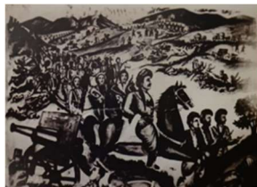
شیوه‌ی ژماره (۱۲)