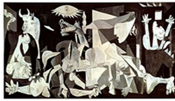
شىوه ی ژماره (v)

نازاره كان بابه تىكى به رده وامه له هونه ردا و نه رىتى نىگار كېشانى توندوتىژى و نازار و قوربانى و سته مكاران له مېژه سه رچاوه ی ده رپرېن بووه بۆ ئه و هونه رمه ندانه ی كه تووشى ملاملانى ده بن. دواى ئه وه ی جه نه راللىكى فاشىست (Fascist) دىوار به ندى جۆر نىكا (Guernica) بىنى وه ك له شىوه ی ژماره (v) دياره، كه "زۆر به دزىوى وېنه ی ئه و سووتان و ئاگر تىبه ردانه ی بازارى گوندىكى ئىسپانى پىشانده ات كه فرۆكه كان له جه نگی ناوخۆدا بۆردومانىان كرده، جه نه راله كه له بىكاسۆى (Pablo Picasso) پرسى: ئايا تۆ ئه م تابلۆى جۆر نىكات وېنه كېشاوه؟ ... بىكاسۆش له وه لامدا ده لىت: نه خىر ئه وه ئىوه دروستتان كرده وه." (William, R, 1996, p.126)