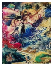
شیوه‌ی ژماره (۱۳)