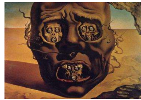
شىوه ی ژماره (5)

مېژوو يه كېكه له گرنگترين كارىگه رىبه كان كه هه ستى هونه رى كۆمه لگانان له و قۆناغانه دا ديارى ده كات، ئه زموونه كان و هه سته كانىان رۆللىكى بنه رپه تى ده گېرېن له به رجه سته كردنى هونه ره كه دا، ئه و هونه رمه ندانه ی ئه زموونى جه نكه كان ده كهن مه يلان بۆ ئه نجامدانى كاره كانىان به شىوه يه كى گشتى جياواز بووه. له كاتىكدا "زايۆن له رۆژانى كۆتاييه كانى جه نگی جيهانى دووه مدا ئاسنى كه م بوو، سه ركردايه تى سه ربازى به دواى كه ره سته ی دىكه دا ده گه رپا بۆ ئه وه ی نارنجۆكه كان دروست بكهن. يه كېك له هه لېژاردنه كان سىرامىكى نه رىتى بىزن (Bizen pottery) بوو له پارىزگای ئۆكاياما و شاره زای سىرامىكى بىزنى ئه و رۆژه فه رمانى پىكرا كه دروستيان بكات" ( Shimpei Matsumoto, 2022, p.47) بروانه شىوه ی ژماره (8) نموونه ی نارنجۆكه كانى ئه و كاته يه.