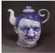
شىوه ی ژماره (6)