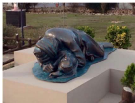
شیوه‌ی ژماره (۱۴)