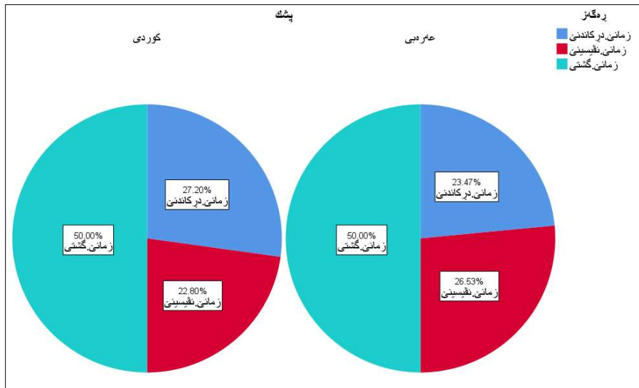
نه خشه یی ژماره (3) بر گه یین تاقیکرنی ل دو یف بگۆری پشکان