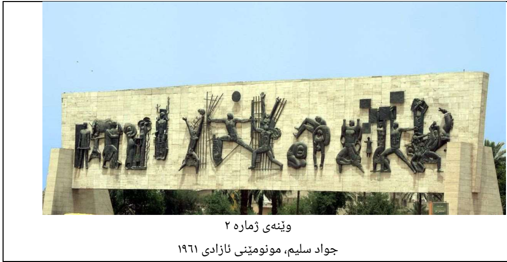
وینه ی ژماره ۲

موحه ممه د حوسنی؛ الفراهیدی ، په یکه رتاش میران سه عدی و المتنبی له لایهن په یکه رتاش عه بدولکه ریم نه لگه یلانی) یه وه داده نرین.