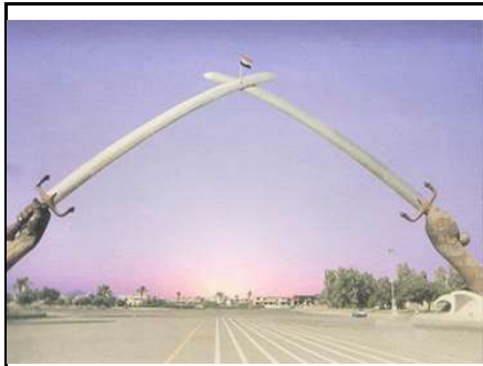
وینه ی ژماره ۷ خالده حال، قوس النصر. ۱۹۸۹