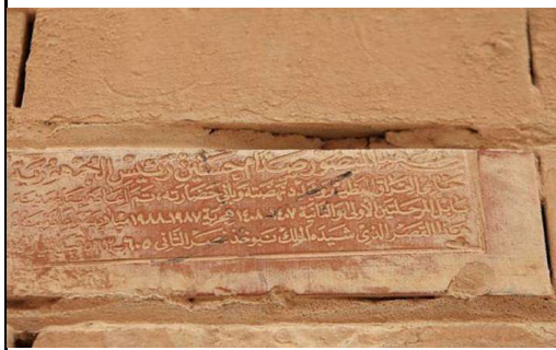
وینه ی ژماره ۸. نویژهن کردنه وه ی کۆشکی نه بوخوزنه سر. ۱۹۸۸