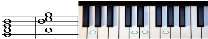
نمونه ي ژماره (6) دانانى كۆرد بۆ سيچاره گه دهنگ

ئهمه ي كه باسمان كرد ته نها وه كو تيبينيه ك بوو چونكه تا ئيستا له هيچ گۆرانيه كي رۆژه لاتي ئهم جۆره كۆرده نه بينراوه.