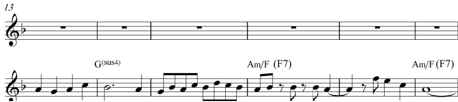
نمونه ي ژماره (6) بارى 13 تا 18

ئهمه ي كه باسمان كرد ته نها وه كو تيبينيه ك بوو چونكه تا ئيستا له هيچ گۆرانيه كي رۆژه لاتي ئهم جۆره كۆرده نه بينراوه.