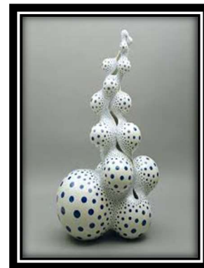
ويئنهى (3) سىرامىكى يابانى

هونهرى خهزهف "له رووى شىواز و تاييهتمهئدى و روانگهوه گرینگى زۆر دهئات به لايهنى پيشكهوتنى تهكنيكى كارهكه له رووى جوانى و دهربرپىنى وداهينيانكاريدا بۆ دهرخستنى به شىوهبهكى هۆنراوهى ريكدهخريت له سهروهوى جوانى بۆ نيشاندانى نايابى كارهكه" (صاحب، 2006:75). تاييهتمهئدىيه هونهرييهكان به پيى جياوازى ئه و رهگهزانهى كه لايانهوه پيكهاتوو دهگورپن كه هونهرمهئد به گوزارشتيكي پهيوهپست به توانا هونهرييهكهى گوزارشتى ليدكات، به تاييهت گلينهكار له دۆزينهوهى خاصيهته هونهرييهكان چ له شىوه نهرىتاييهكان يان سرووشتييهكان و پاشان دهرخستنى به شىوهبهكه كه پهيوهئدى له نيوان بهشهكانى شىوه و ناوهرۆكى كارى هونهرى دروست بكات به شىوهبهكى گۆراوى نوئ كه واى له گلينهكارى كرد وهك هونهرييكى راستهقىنه دانهخراو به رووى لايهنى پيشهئى گهشه بكات.