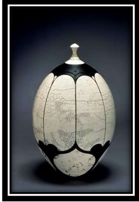
ويئهى (2) پاكۆ