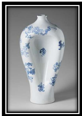
ويئنهى (4) سىرامىكى چىنى