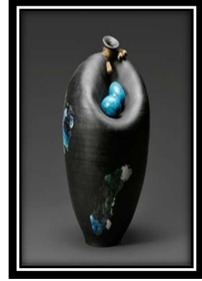
ويئهى (1) پاكۆ

"له سه ره تاكانى سه دهى (20) دا زۆر بهى كار هه زه فهى كان به شىك بوون له جوانكارى، بىگومان باس له خه زه ف بكرىت، ده بىت باس له خه زه فى چىن و يابانى بكرىت وهك ويئهى (3_4) كه ئه مانه سه رچاوهى په يدا بوونى خه زه فى كۆن و نوين، خه زه ف وهك جوانكارى نيو كوشكه كان و په رستگان به كار دهات، به لام دواتر له سه رده مى نويدا و ايان كرد كه متر پارهى تىبچىت، له سه ر دارنه خشه كانيان ده كرد دواتر ته بعى سه ر قوره كه يان ده كرد رهنگى زياتر و مادهى جوانترىان به كار هينا بۆ هۆى ئه وهى ئه ورپيه كان لاسايى كار هكه يان بكه نه وه، شىوازه كه بىگۆرپىن بۆ ئه وروپى ئه مريكى" (رالف لنتون، 2001: 329). به و واتايه بىت هونه رى خه زه فى يان سىرامىك، قوتابخانه نايابه كهى له ولاتانى ئاسيايه به تايبه تى چىن و ژاپۆن كه ئه ورپيه كان پى سه رسام بووينه، به ته كنىكى خۆيان لاسايان كرده و نه ته وه.