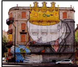
وینهى (٧) بلو (Blu)، مژینی جیهان و وشكردنى، (لیشبنونه) له پرتوگال (٢٠١٠)

وینهكيشانى گرافیتى سهردیوار كرد. بهخیرای ناسراو ناوبانگیکى زۆرى بهدهست هینا، ئهویش به وینهكيشانى زنجیرهى گرافیتى له گهرهكهكانى شارى (بۆلۆنیا) له ئیتالیا. لهو چهند سالهى دواى دهست پیکردنى لهكارهكانى له سهههتاکانى سالانى (٢٠٠٠) دا شپوازی گرافیتى بلو گۆرانكارى بهسههراها، ئهویش بههۆى پيشکەوتنى ئه و بۆیانهى كه بۆ مال بهكار دههات. هونهرهكهى زۆر سیمایهكى دراماتیکى دهگهپاند. ههر زوو دهستى كرد به کيسانى فيگههرى مرۆڤى زهبهلاح، كه زۆر جار له پووكهش دا گالته جارانه بوو له هونهرى كۆمیدى و یارى شیديۆبى دهچوو]. https://www.streetartbio.com/artists/blu بلو وینهى كۆمپانیاپههكى كپشاهه كهوا چاكهت و پانتۆلى له بهر دایه كهوا جیهان ده مژیت و ووشكى دهكات. له سهههرا تاجیکى زيرينى داناهه وه لوگوى دهوله مهنده ترين كۆمپانیا نهوتیهكانى جیهانى له سهههه لهوانه شيفرۆن و شیل و ئیسۆ و تكساكۆ. وهك له وینهى (٧) دا دهپینرئ.