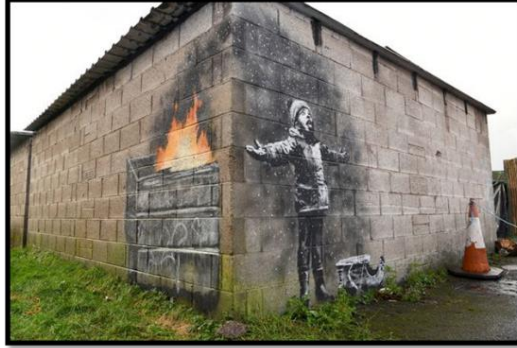
ويئنه ي (٢)