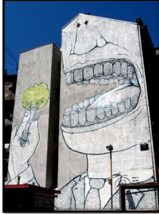
ويئنه ي (١)