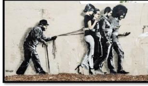
وینەى (۲) هيجاك: HIJAC ھۆليود: ۲۰۱۸