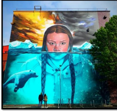
ويئنه ي (٣)

ناونيشان: گرېتا تونبييرگ چالاکوانى دژى گۆرانی کهش و ههوا