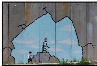
ويئهى (٦) بانكسى: ديوارى فه له ستين كه رتى رۆژئاوا (٢٠٠٥)

بهكاردههينيٲ بۆ گهياندى نارهبازيى لهلايهنى كۆمهلگاو ه يان كيشه رامياربهكانى جيهان وه تهبانهت لهڊى سهركردهى ولاتان. "بانكسى ڊزه جهنگ و شوڧشگير و خه مخورى ژينگه و په نابهر و مرؤڧ و منال و هيتر... بۆيه به ديواره بنديه كانى ئه م بابه ته ههستيارانه دهورژيني و شوكمان دهكات. بۆيه به هونه رمه نڊيكي ئه فسانه ي گرافيتى ئه و سه رده مه داده نريٲ، شوينيكي گرينگى له كه سايه تيه به ناوبانگه جيهان به كان ههيه له وشيار كرده وهى جيهان له گرفت و ڊوزى سه رده م، توانيو به تى به توانا گه و ره كانى له ديواره بندى روى كيشه جوڦاو جوڦه كانى جيهان هه ل مالىٲ و جيهانى لى ناگادار كاته وه به روى. [Auriemma: 2019]" به كيك له كاره گرينگه كانى كه له سه ر ديوارى فه له ستين كيشاويه تى وه ك ويئهى (٦) دا ده بينريٲ. كه ويئكه پيك هاتوو ه له باگراونڊيكي شينى ئاسمانى كه چوارچيويه كهى وه ك درزيك درووست كرده وه هيله كانى درزى ديواره كانى وه ك خوى داناوه ئه مه ش وا پيشان ده دات كه وا فه له ستين بۆته گه و ره ترين به ندينخانه به كى كراوه له جيهان. له ويئكه دا كه وا منڊاليكى به هونرى گرافيتى درووست كرده وه كه سه تليكى زه ردى له ده سته له گه ل فلچه به ك وه ك ئامازه به وه ده كات كه نه وهى منڊالانى بيتاوان ژيانيان له نيو ديوارى كى چيمه نتوى گه و ره ده ژين. وانيشان ده دا كه وا منڊالان داهاتوو خويان رهنگ بكن، خه ون و ئاره زوو يان به يننه دى.